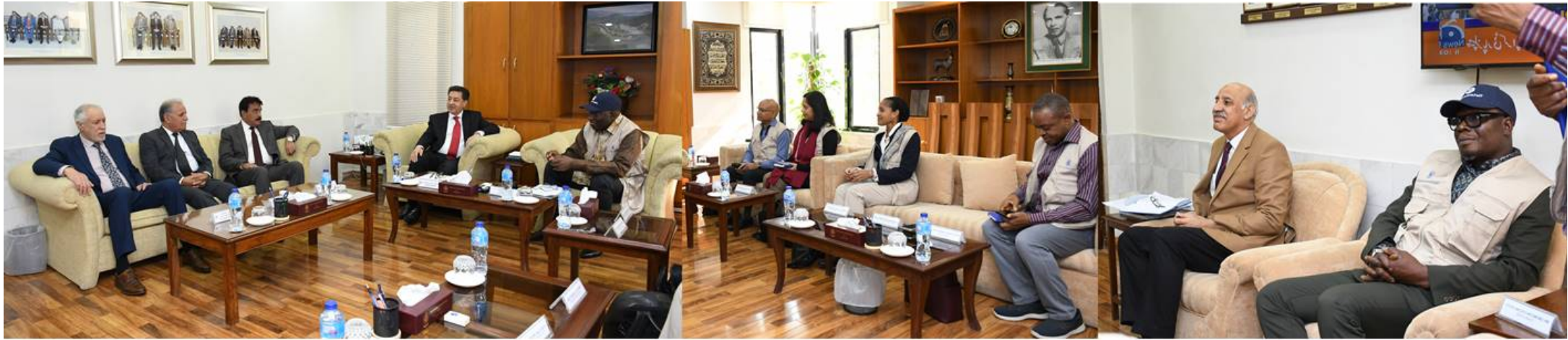
Islamabad: Honourable Chief Election Commissioner, Sikandar Sultan Raja, met Chair H.E. Goodluck Ebele Jonathan, Head of Common Wealth Observer Group at ECP secretariat.